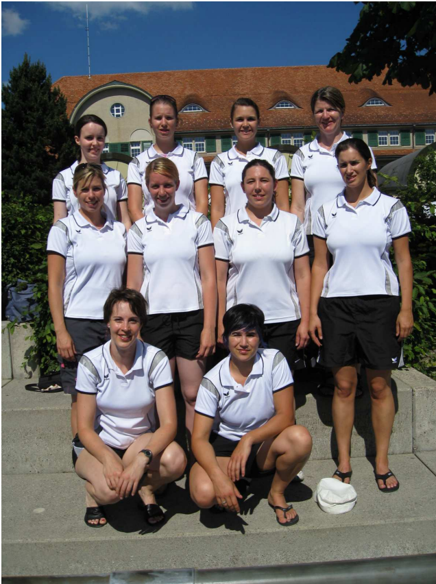
Team Aerobic: Note 8.83 / 10 Turnerinnen