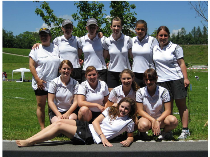
Schleuderball: Note 8.40 / 10 Turnerinnen