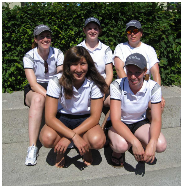
Kugelstossen: Note 7.61 / 5 Turnerinnen

Anschliessend ging es per Shuttle-Bus oder zu Fuss sofort weiter zum zweiten Wettkampfteil. 10 Turnerinnen starteten im Team Aerobic, 10 Turnerinnen beim Schleuderball und 4 Turnerinnen mit der 4x100m-Staffel. Erfreulicherweise konnte sich der Verein nun deutlich steigern und alle drei Riegen erzielten gute Resultate. Die Team Aerobic-Gruppe erhielt für ihre gelungene Darbietung und die anspruchsvolle Choreographie die sehr gute Note 8.93. Die 10 Turnerinnen beim Schleuderball waren eine Durchschnittsweite von 31.32m, was ihnen die Note 8.40 einbrachte. Und die vier Turnerinnen der 4x100m-Staffel ersprinteten sich mit einer Zeit von 56.11 sek. die gute Note 8.72.