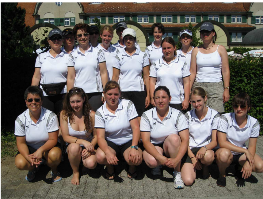
Fachtest Allround: Note 8.71 / 16 Turnerinnen

Motiviert durch diese guten Resultate ging man zuversichtlich weiter zum dritten und letzten Wettkampfteil. 16 Turnerinnen absolvierten den Fachtest Allround, vier Turnerinnen starteten beim Weitsprung und fünf beim Hochsprung.