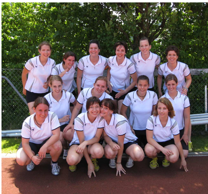
Pendelstafette: Note 8.11 / 14 Turnerinnen

Aus der Pendelstafette und dem Kugelstossen resultierte somit im ersten Wettkampfteil leider nur eine Durchschnittsnote von 7.98. Eine klare Enttäuschung, eine Leistungssteigerung musste nun im weiteren Wettkampf her!